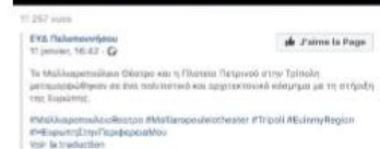
Social media content